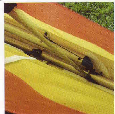
Barre de rappel intégrée

Structure entièrement "pérunal" Menziken Lattes "zicral" indéformables Bord de fuite intrados, extrados en tissu composite trilam Voile stabilisée en 185 g/m 2