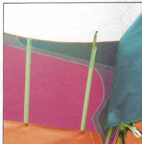
Renfort de voile Trilam