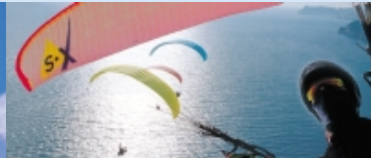
CT - Excellence in light air sports.